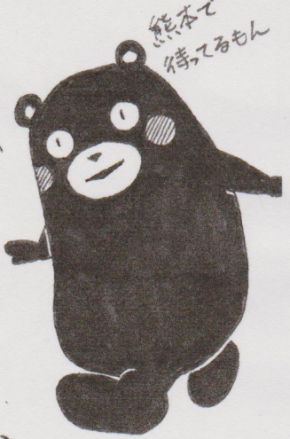
熊本で 待つ Kumamon